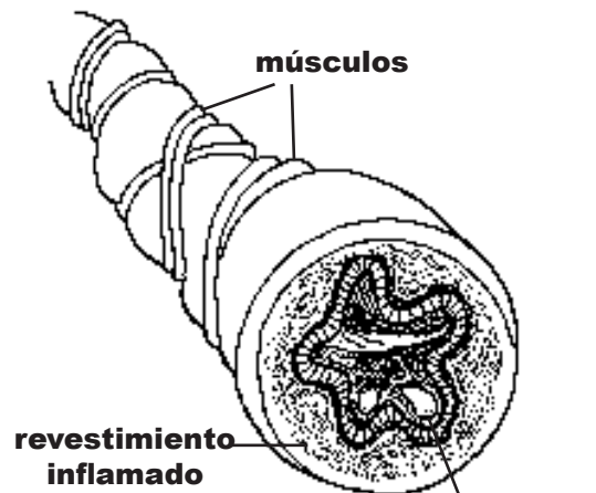
tubo respiratorio durante una crisis de ERVR o de asma