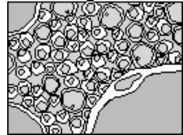
Apariencia de la médula ósea bajo el microscopio.

La médula ósea se encuentra dentro de los huesos grandes del cuerpo. Es la que produce las células sanguíneas. En una aspiración de médula ósea se toma una pequeña muestra de médula ósea líquida del cuerpo, para observar las células sanguíneas. Un enfermero profesional o un doctor introduce una aguja dentro del hueso, por lo general el hueso de la cadera, y lentamente sacará un poquito de médula ósea hacia la jeringa. La médula ósea es roja, y se parece a la sangre.