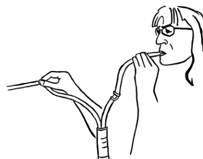
Aspire la sonda como si fuera un popote.