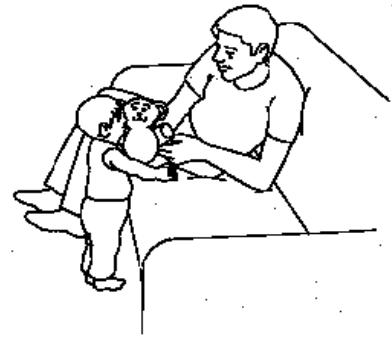
Ayúdele a su niño a tomarse de los muebles y a aprender a mantener el equilibrio.