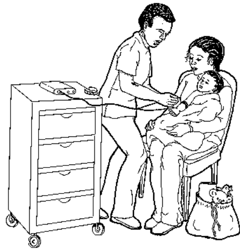
El técnico del laboratorio juntará el sudor en un pedazo de papel de filtro.

Después, se colocarán dos discos redondos de metal en la piel por cinco minutos. Los discos se conectarán a cables que están conectados a un pequeño aparato. Cuando se prende el aparato, su niño sentirá un hormigueo, como lo que usted siente cuando su pie se duerme. Algunos niños describen una ligera molestia. En unos pocos minutos se apagará el aparato, y se removerán los discos de la piel.